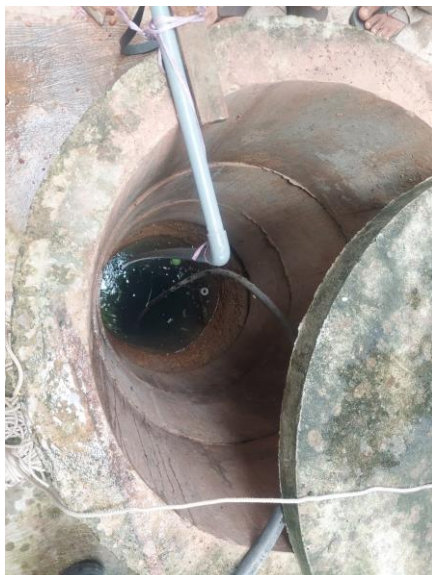
Pengaduan Limbah Produksi Bakso Di Tanjung Rema Darat mencemari sumur warga

Pada Sub Kegiatan ini adalah Pelayanan Pengaduan Dugaan Pencemaran dan Kerusakan Lingkungan Hidup yang untuk memberikan pelayanan kepada perusahaan dan masyarakat terkait permasalahan lingkungan. Target pada Sub Kegiatan ini yaitu jumlah pengaduan pencemaran dan kerusakan lingkungan hidup dapat terlayani dengan baik dengan target kinerja 20 kasus dan realisasi yang tercapai untuk triwulan ke IV adalah 10 Kasus pengaduan tingkat capaian kinerja hanya 50%