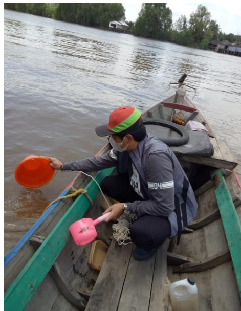
Pemantuan air di Kec. Aluh aluh desa Sungai musang