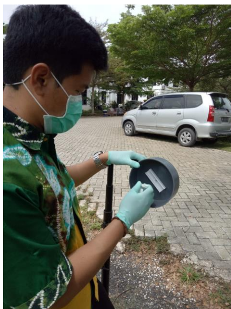
Pemantuan udara Passive Sampler di titik Hal. Perkantoran DLH