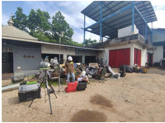
Pengendalian Pencemaran udara