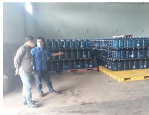
Pengawasan Izin Lingkungan