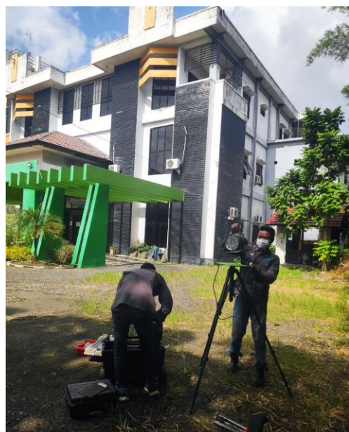
Pemantuan udara di Jalan A.Yani 37.5 km