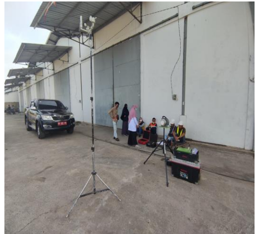
Pengendalian Pencemaran udara