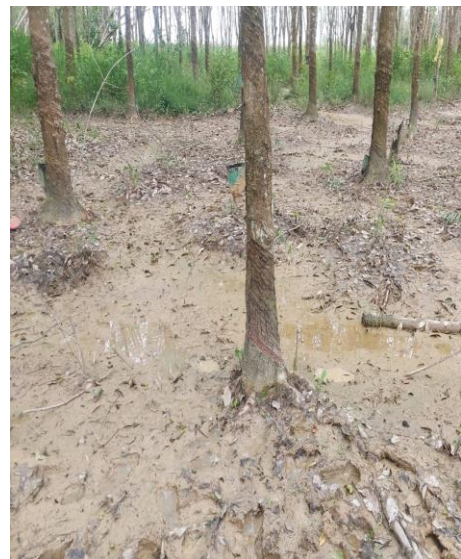
Limbah Tambang di Cintapuri mencemari perkebunan karet dan persawahan.