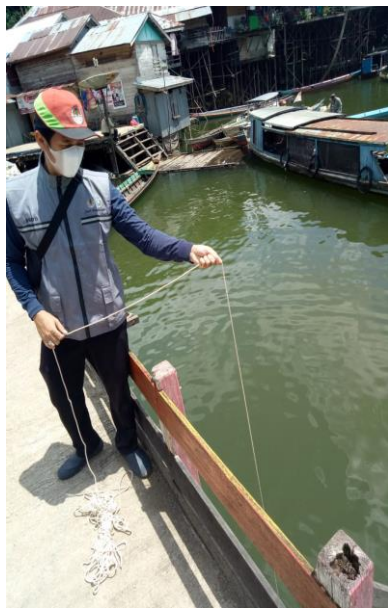
Pemantuan air Desa Aranio

Jumlah Pelaku Usaha Yang Telah dilakukan Pembinaan Dan : 20 Perusahaan Pemantauan Sumber Emisi Udara Di Lingkungan Industri Jumlah Pelaku Usaha Yang Telah dilakukan Pembinaan Dan : 40 Perusahaan Pemantauan Sumber Pencemar Air Di Lingkungan Industri Jumlah Perusahaan yang mengikuti Sosialisasi Dan Bimbingan : 100 Perusahaan Teknis Kewajiban Pembuatan Laporan Izin Lingkungan Jumlah Perusahaan Yang Terlayani oleh Klinik Pengendalian : 40 Perusahaan Pencemaran Jumlah titik pantau air sungai : 95 titik pantau Jumlah titik pantau udara : 12 titik pantau