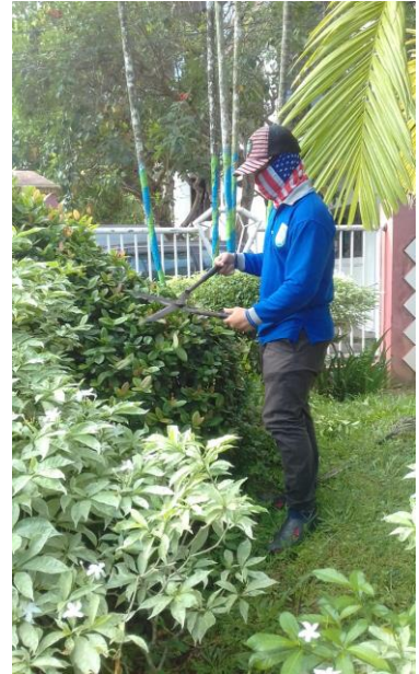
Pemeliharaan RTH Taman CBS