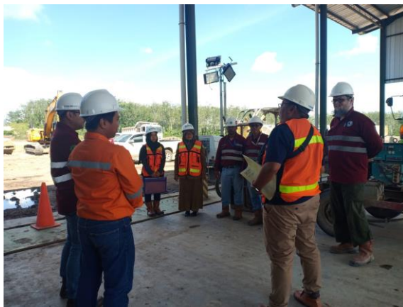
Verifikasi Limbah B3

Pada Sub Kegiatan ini adalah Verifikasi Lapangan untuk memastikan Pemenuhan Persyaratan Administrasi dan Teknis Penyimpanan sementara Limbah B3 yang sudah terlaksana di triwulan IV sebanyak 19 pelaku usaha dengan capain 54,29%