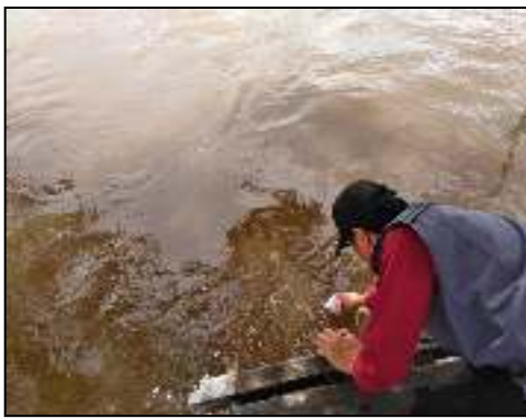
Desa Pinang Lama Kec. Sungai Tabuk