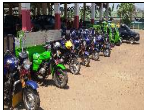
Gambar Pengoperasian dan Pemeliharaan Sarana dan Prasarana Penanganan Sampah di Pool Armada