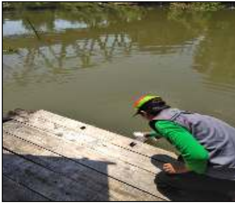
Desa Pingaran Ulu Kec. Astambul