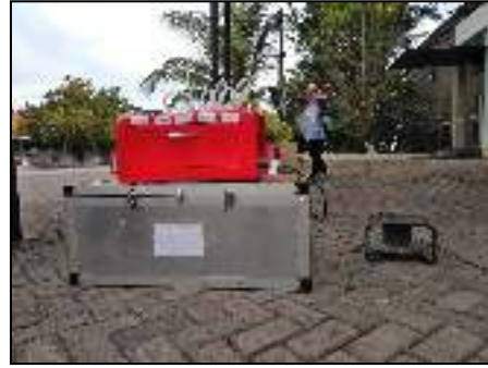
Bunyamin Residence (Pemukiman)