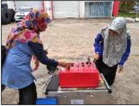
Pergudangan bizpark (Perkantoran)