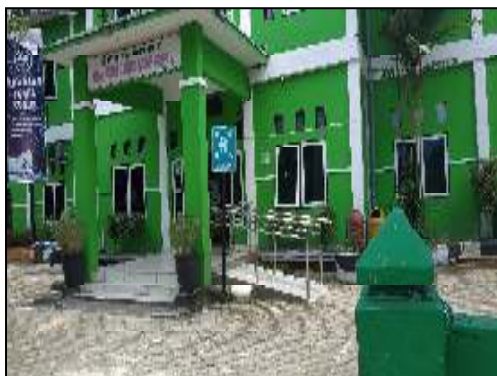
Upt. Puskesmas Martapura