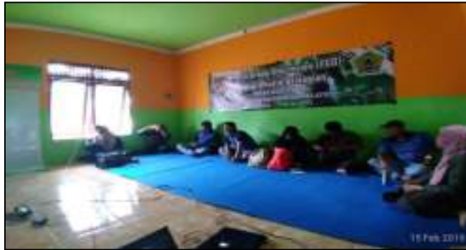
Gambar Peningkatan Peran Serta Masyarakat Dalam Pengurangan Sampah