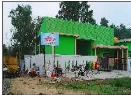
Sarana dan Prasarana di TPS 3R Gambut