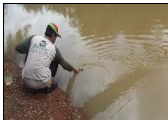
Desa Lawiran Kec. Simpang Empat