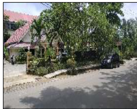
Dinas PUPR Kab. Banjar