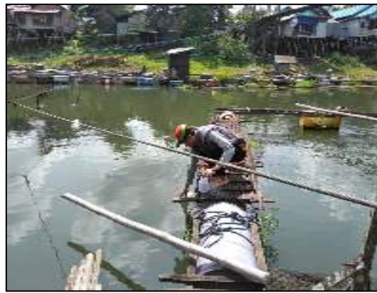
Desa Karang Intan Kec. Karang Intan