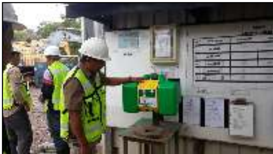
FOTO-FOTO KEGIATAN PENGAWASAN KETAATAN IZIN LINGKUNGAN & IZIN PPLH

Outcome : Meningkatnya peran serta pelaku usaha terhadap pelaksanaan pengelolaan lingkungan